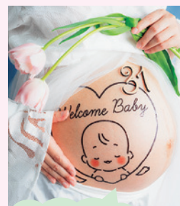
マタニティフォトの撮影もしています

ていきたいです。ウエディングフォトは、名寄市には自然豊かな場所があるので、素敵な場所が沢山あるんです。商品撮影は、以前スキンケアサロンで働いた時に化粧品販売をしていて、どうしても欲しいものがあったら、どうしたら欲しいものを買いたいのかと考えながら仕事をしていました。真つ白な背景の商品の写真を撮るなど高度な技術が必要となり、真など商品販売の経験を活かし、商品がより素敵に見えるような写真を撮りたいと思うようになったので、地元企業様の力になれるようなことがあれば挑戦したいです。大きな目標としては、「名寄市にオシャレな写真スタジオがある」と聞いて来てくれるような、名寄市だけでなく他の市町村のお客様も集まってくるようなスタジオにしたいと思っています。