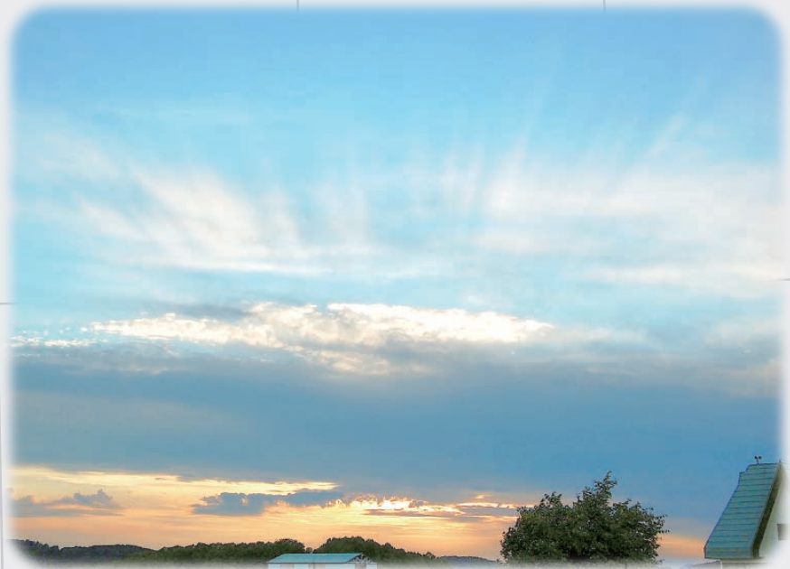
士別市：羊と雲の丘公園からの夕景

地域の皆様に金融面以外でのお手伝いができるよう、名寄市立大学や上川総合振興局との提携、ビジネスマッチングなど金融以外の分野でのお客様への支援を通じて地域に貢献できる体制を整備しております。